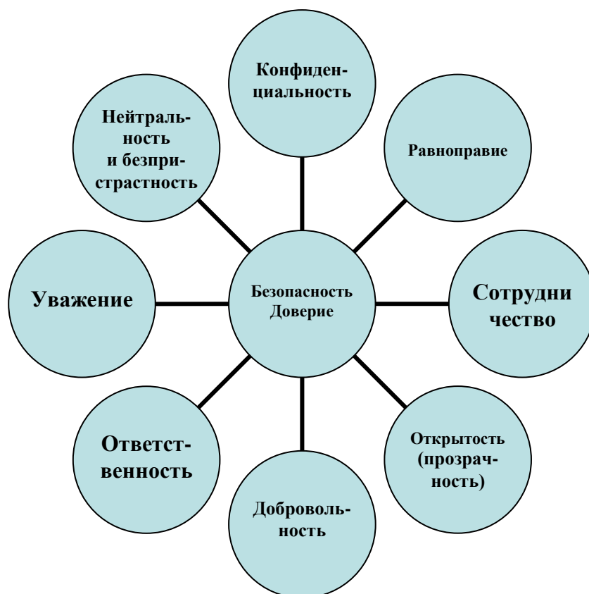
Рис. 3. Принципы медиативной беседы «взрослый – ребенок»

План проведения медиативной беседы в свою очередь предполагает: